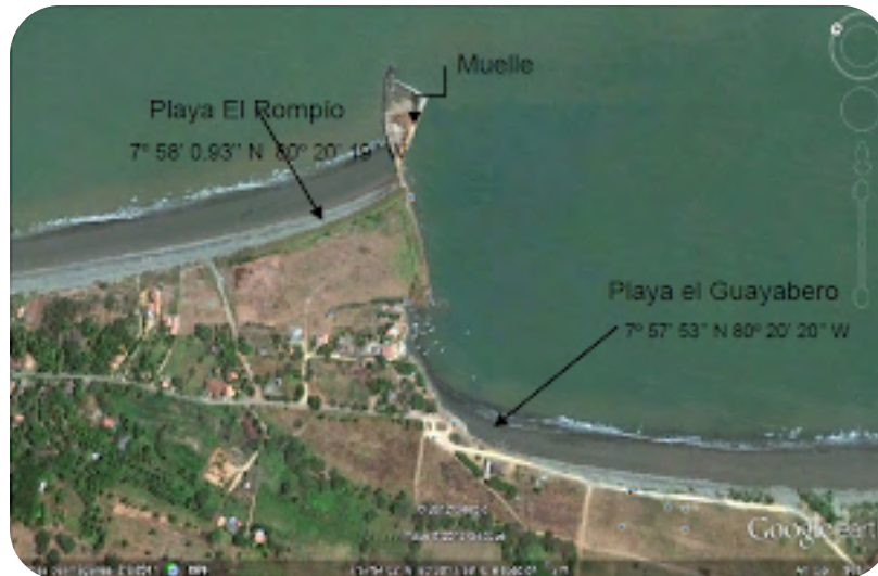
Captura de imagen por medio del Google Earth.

80° 20' 19" W, mientras que la playa Los Guayaberos se ubica en las coordenadas 7° 57' 53" N y 80° 20' 20" W, lo que permite precisar su localización cartográfica dentro del sistema de referencia geodésico.